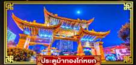
ประตูน้ำทองโก่หยก