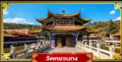
วัดหยวงทง

มหัศจรรย์ "แผ่นดินสีแดงตงชว่น" นั่งกระเช้าขึ้นสู่อยอดภูเขาหิมะเจี๋ยจื่อ