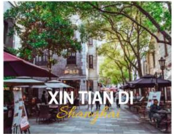
XIN TIAN DI Shanghai

ย่านใหม่ใจกลางเมืองเซี่ยงไฮ้ อีก 1 ย่านช้อปปิ้งและร้านอาหาร ร้านอาหารที่มีเอกลักษณ์ จากสถาปัตยกรรมที่ใช้อิฐบล็อกแบบสถาปัตยกรรมชิคเก๋มึน ซึ่งเป็นการผสมผสานกันระหว่างสถาปัตยกรรมจีนกับตะวันตกเข้าด้วยกัน ท่านจะพบกับทางเดินหิน กำแพงหิน ประติมากรรมที่มีเอกลักษณ์ โดย 2 ทางของถนนมีต้นเมเปิ้ลตลอดทาง ยิ่งทำให้ย่านนี้มีเสน่ห์เพิ่มเป็นเท่าตัว