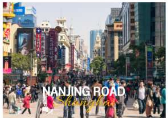
NANJING ROAD Shanghai

ถนนหนานจิง หรือที่รู้จักกันอีกชื่อว่า นานกิง ย่านช้อปปิ้งที่เก่าแก่และมีชื่อเสียงที่สุดในเซี่ยงไฮ้เลยในตอนเย็นจะเป็นเวลาที่ร้านค้าและบาร์ต่างๆกำลังคึกคักมีนักดนตรีริมถนนเต็มไปด้วยแสงสีเสียงเหมาะกับการเดินเล่นหรือนั่งรถรางชมบรรยากาศรอบๆฝั่งตะวันตกจะมีห้างสรรพสินค้าใหญ่ๆสลับกับร้านแบบจีนดั้งเดิมอยู่ตลอดสองข้างทาง