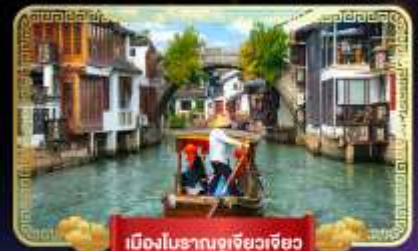
เมืองโบราณอูเจียวเจียว