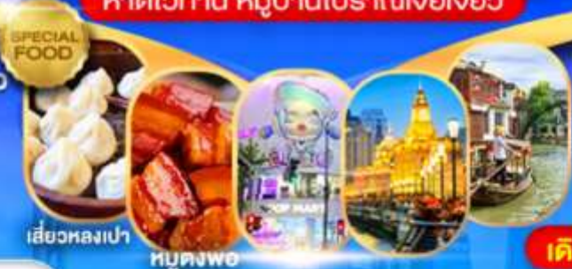
เสี้ยวหลงเป่า