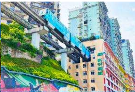
รถไฟวิงทะเลติก