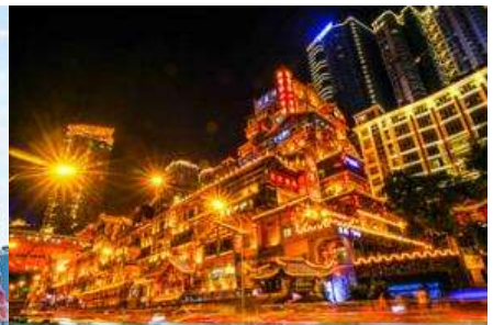
ย่านหยงหยาดัง