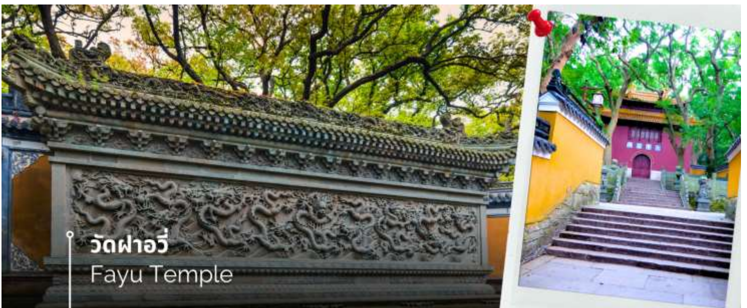
วัดผาอวี Fayu Temple

หลังอาหารนำท่านนมัสการองค์พระโพธิสัตว์ เจ้าแม่กวนอิมไม่ยอมไป วัดไผ่สีม่วง อีกหนึ่งวัดที่ตั้งอยู่บนเกาะผู้โถวซาน ซึ่งที่นี่ได้รับสมญานามว่า “เกาะพระโพธิสัตว์” เพราะเป็นวัดเล็กๆ ที่อยู่ติดกับทะเล สาเหตุที่เรียกว่าวัดไผ่ม่วง เพราะว่าบริเวณนั้นมีต้นไผ่สีม่วงขึ้นเยอะ และความพิเศษอีกอย่างหนึ่งคือ ต้นไผ่สีม่วงจะมีในเกาะแห่งนี้ที่เดียว สำหรับไฮไลท์เด็ดของที่นี่คือ “เจ้าแม่กวนอิมไม่ยอมไป” ซึ่งวัดนี้มีประวัติมาอย่างยาวนาน ตั้งแต่สมัยราชวงศ์ถัง (ค.ศ.961) ซึ่งเป็นยุคที่พุทธศาสนามีความเจริญรุ่งเรืองในแผ่นดินจีน พระโพธิสัตว์ศักดิ์สิทธิ์องค์นี้ไม่ยอมรับอัญเชิญไปประดิษฐานที่ญี่ปุ่นตามการอัญเชิญของหลวงพ่อยุ้ยเอ้อ ภิกษุชาวญี่ปุ่นที่มาศึกษาพระธรรม องค์ท่านจึงได้ดลบันดาล