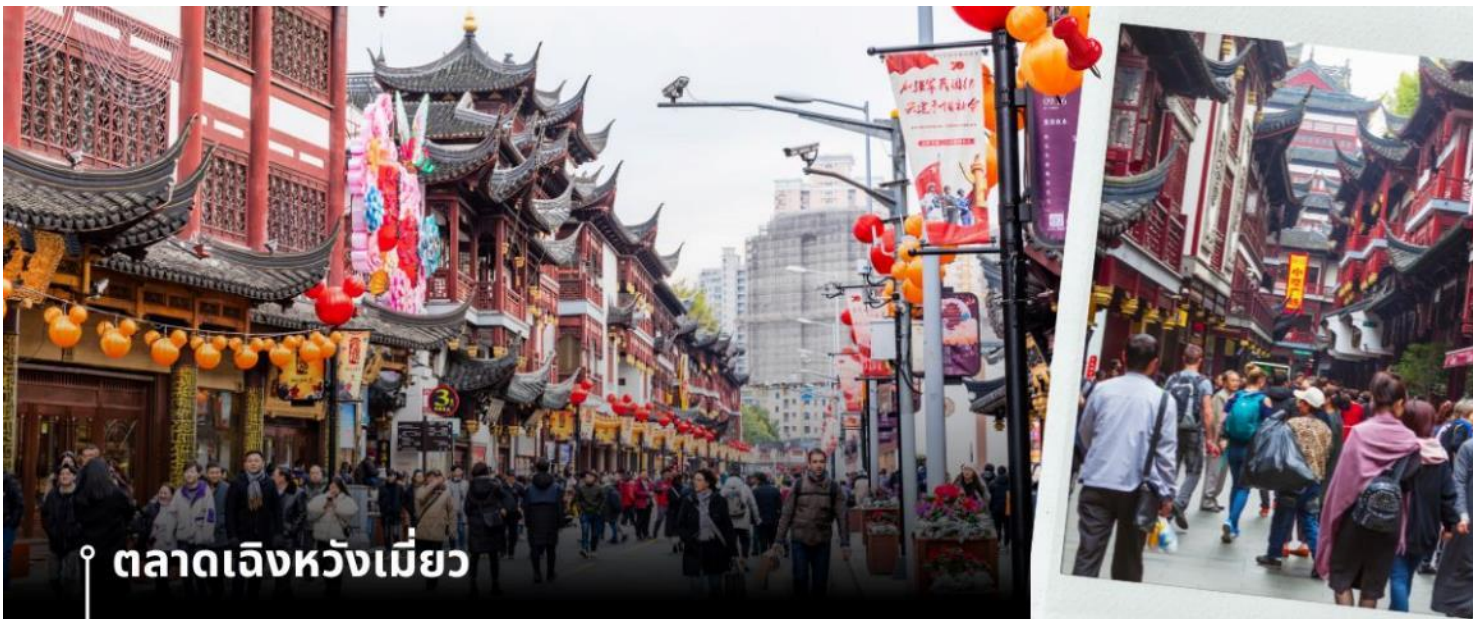
ตลาดเจิงหวังเมี่ยว

เที่ยง 📍รับประทานอาหารกลางวันที่ภัตตาคาร (4) นำท่านเดินทางกลับสู่มหานครเซี่ยงไฮ้ โดยใช้เวลาเดินทางประมาณ 2 ชั่วโมง จากนั้นนำท่านชม ตลาดเจิงหวังเมี่ยว หรือเป็นที่รู้จักในชื่อ ตลาด 100 ปี เจินหวังเมี่ยว เมืองเซี่ยงไฮ้ (Chen Wang Miao) ถือว่าเป็นตลาดเก่าของผู้ตั้ง เมืองเซี่ยงไฮ้ อาคารบ้านเรือนบริเวณนี้เป็นสถาปัตยกรรมโบราณสมัยราชวงศ์หมิงและชิง ตกแต่งสไตล์สถาปัตยกรรมแบบโบราณจีน และเก่ากว่าร้อยปี