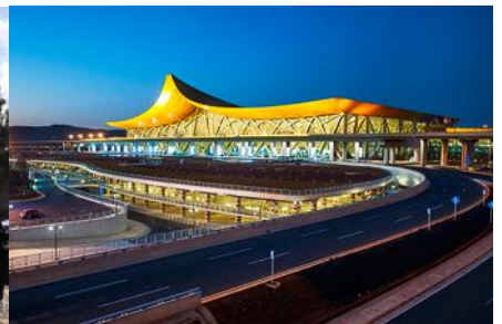
สนามบินเบียวคุนหมิง