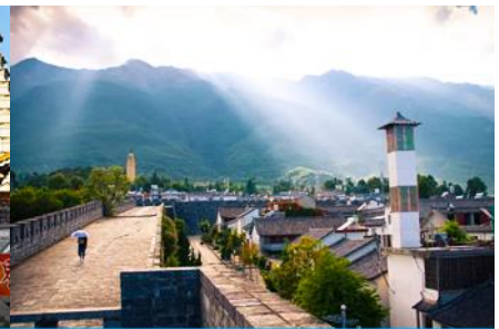
หมู่บ้านซีโจว(หมู่บ้านชาป๋วย)