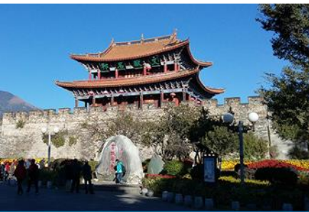
เมืองโบราณต้าลี่

ค่ำ รับประทานอาหารค่ำ ณ ภัตตาคาร หลังอาหารนำท่านเข้าสู่ที่พัก พักที่ DALI ZHUANG HOTEL ระดับ 4 ดาวหรือเทียบเท่าในเมืองต้าลี่