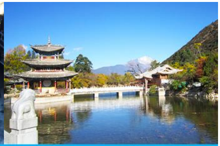
สะพานมังกรดำ