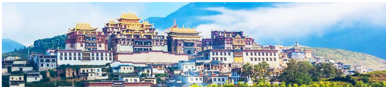
เมืองโบราณแชงกรีล่า

จากนั้นนำท่านเดินทางสู่ เมืองจางเตี้ยน โดยใช้เส้นทางด่วนวิ่งตรงเข้าเมือง จางเตี้ยน ใช้เวลาเดินทางประมาณ 2 ชั่วโมง สู่ เมืองจางเตี้ยน หรือดินแดนแห่งแชงกรีล่า ซึ่งอยู่ทางทิศตะวันออกเฉียงเหนือของมณฑลยูนนานซึ่งมีพรมแดนติดกับอาณาเขตน่านซี ของเมืองลี่เจียง และอาณาจักรหิ ของเมืองหนิงหลง สถานที่แห่งนี้จึงได้ชื่อว่า ดินแดนแห่งความฝัน