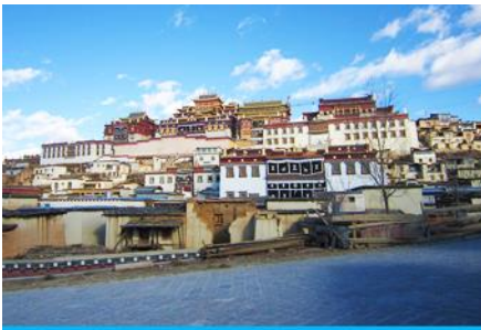
วัดลามะชวงจ้านหลิง