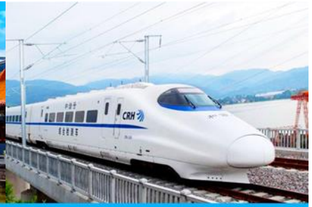
บั้งรถไฟความเร็วสูง