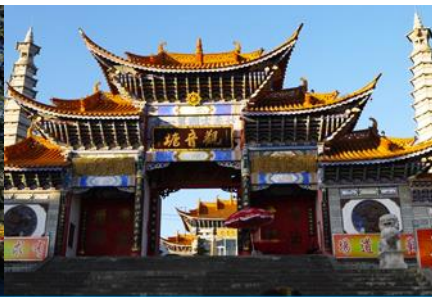
วัดเจ้าแม่กวนอิมเปลงกาย