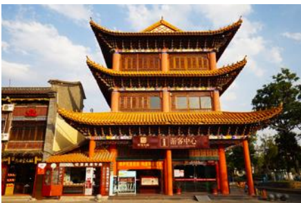
เมืองโบราณกวนตุ๋

พักที่ FEI LONG HOTEL ระดับ 4 ดาว หรือเทียบเท่าในเมืองต้าหลี่