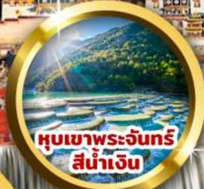
หุบเขาพระจันทร์ สีน้ำเงิน