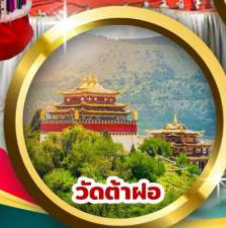
วัดต้าฝอ