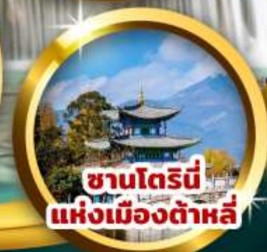
ซานโตรินี แห่งเมืองต้าหลี่