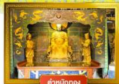
ตำหนักทอง