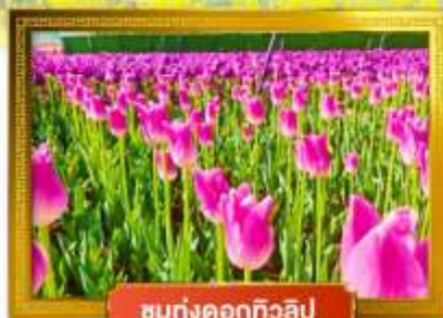
ชมทุ่งดอกทิวลิป