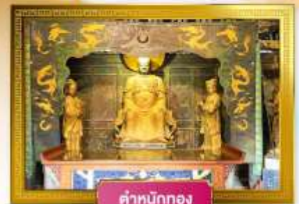
ตำหนักทอง