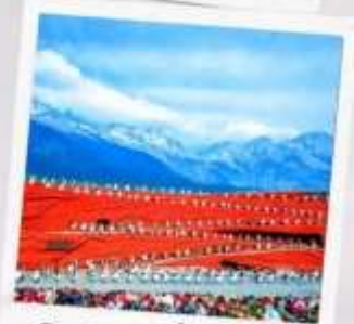
โชว์ จากอ๋โหมว