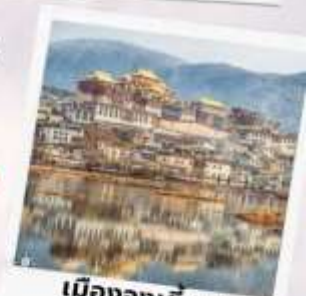
เมืองจางเตียน แซงกรีล่า