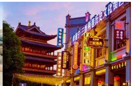
ย่านช้อปปิ้งหลี่หยงชี่ยว