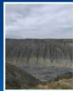
แกรนด์แคนยอน ตู้ซานจื่อ