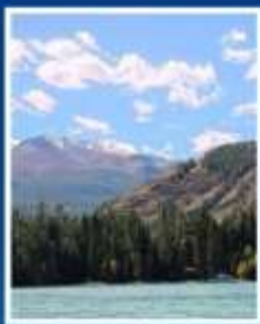
ล่องเรือ ทะเลสาบคานาสี