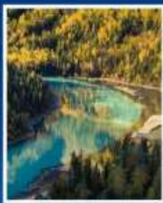
ทะเลสาบมังกรหลับ