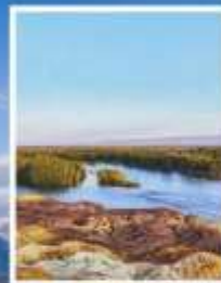
ธารน้ำ 5 สี