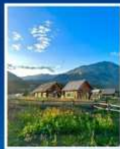
หมู่บ้านเหม่อลู่ซุน