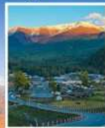
หมู่บ้านไปฮาปา