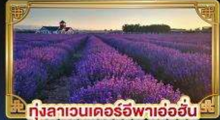
ทุ่งลาเวนเดอร์อิฟาอ้อฮัน