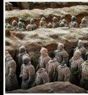
พิพิธภัณฑสถานกองทัพใต้ดิน ทหารม้าจีนซี