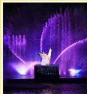
โชว์ MEET XISHI