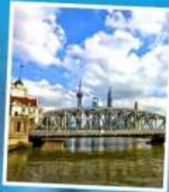
สะพานไว๋ปายตุ้เจียว