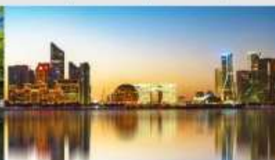
QIANJIANG NEW CITY