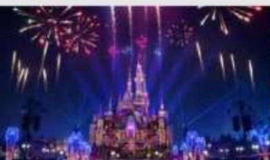
เซี่ยงไฮ้ดิสนีย์แลนด์