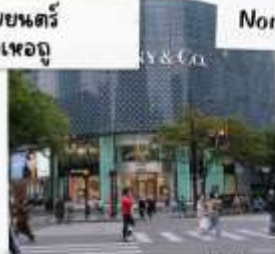
ถนนคนเดินหวยไห่