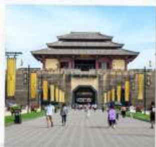
โรงถ่ายภาพยนตร์ ชิงหมิงช่างเหอถู่