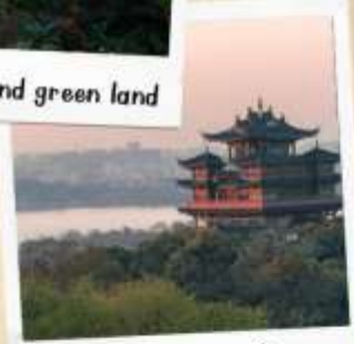
หอเจิ้งหวงเก๋อ