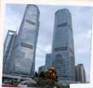
ย่านลู่เจียจู่