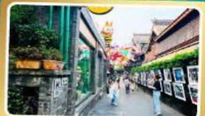
ถนนโบราณชอยกวางชอยแคบ