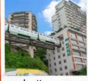
นั่งรถไฟทะลุตึก