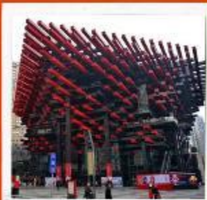
พิพิธภัณฑ์ศิลปะฉงชิ่ง