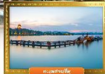
ทะเลสาบอู๋หู