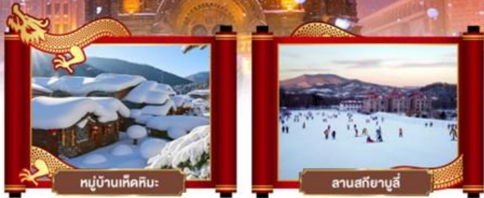
หมู่บ้านหิมะคืบ: