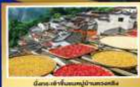
นิคมชาวจีนบนหมู่บ้านหวงหลิง