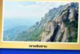
เขาตีสถาน