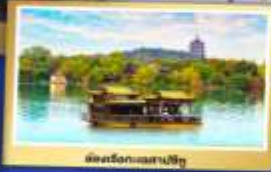
เมืองริ่งกวงเสสปิงอู๋