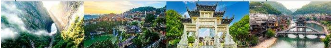
ประตูสวรรค์