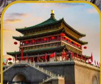
จัตุรัสหอกลอง หอระฆัง