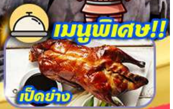
เมนูพิเศษ!!