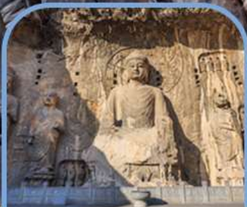
ถ้ำแกะสลักพาสินหลงเหมิน