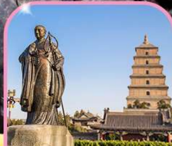
เวดีย์ห่านป่าใหญ่