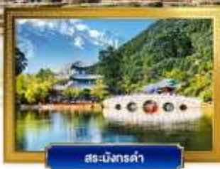
สระมังกรคำ