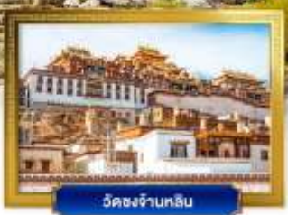
วัดชงจ้านหลิน

เดินทางโดยสายการบินลี้กี้แอร์ อาหาร : 14 มื้อ โรงแรม : 4 ดาว