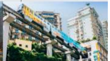
รถไฟฟ้าทะเลสาบ

*ทางบริษัทฯ ขอสงวนสิทธิ์ในการสลับโปรแกรมทัวร์ตามความเหมาะสมขึ้นอยู่กับสถานการณ์ปัจจุบัน โดยคำนึงถึงผลประโยชน์ของลูกค้าเป็นสำคัญ