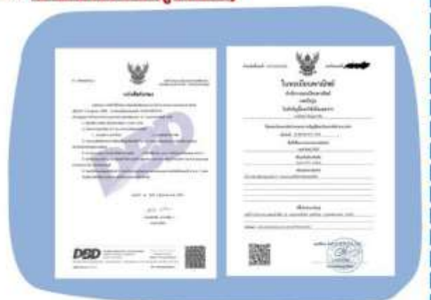
ตัวอย่างหนังสือจดทะเบียนบริษัทฯ และ ใบทะเบียนพาณิชย์