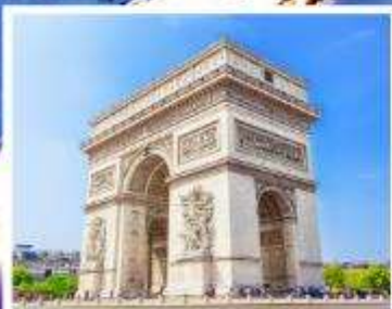
ประตูชัยปารีส