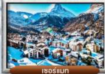
เซอร์แมท

บินหรู สายการบิน Full Service | พิเศษ! ลิ้มลองพองดู 3 ชนิด