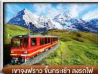
เขา Jungfrau ขึ้นกระเช้า ลงรถไฟ