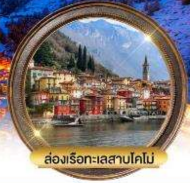
ล่องเรือทะเลสาบโคโม