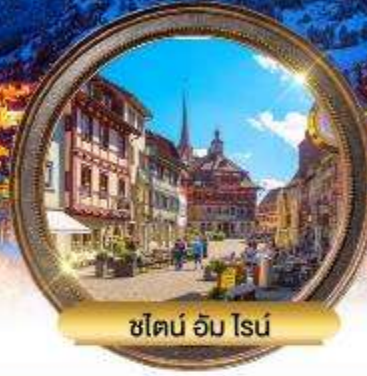
ชไตน์ อัม ไรน์