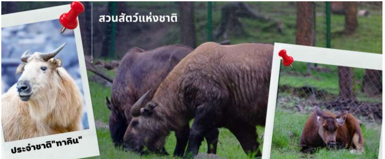
ตัวทาคิน ที่มีลักษณะคล้ายกับแพะและวัวผสมกัน

นำท่านชม สวนสัตว์แห่งชาติของประเทศภูฏาน และชมสัตว์ประจำชาติ ทาคิน ที่มีรูปร่างลักษณะพิเศษผสมระหว่างแพะกับวัว มีแห่งเดียวในประเทศภูฏานเท่านั้น ซึ่งครั้งหนึ่งประเทศสหรัฐอเมริกาเคยเจรจาขอไปเลี้ยงแต่ได้รับการปฏิเสธจากรัฐบาลประเทศภูฏาน ทาคิน เป็นสัตว์ในตำนานประวัติศาสตร์ของศาสนาพุทธ โดยเชื่อว่าท่านลามะ Drukpa Kunley เป็นผู้สร้างขึ้นจากกระดูกของแพะและวัวที่ท่านได้ทานเป็นอาหาร กองกระดูกก็กลับมามีชีวิตอีกครั้งกลายเป็น