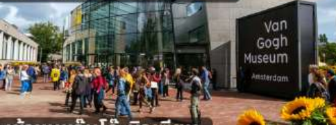
เข้าชมแวนโก๊ะมิวเซียม