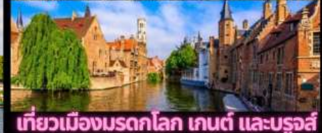
เที่ยวเมืองมรดกโลก เกนต์ และบรูจส์