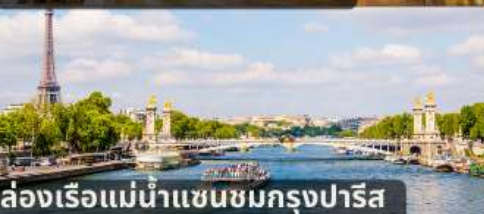
ล่องเรือแม่น้ำแซนชมกรุงปารีส