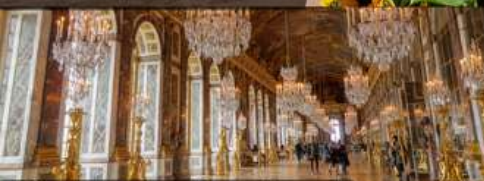
เข้าชมพระราชวังแวร์ซายส์