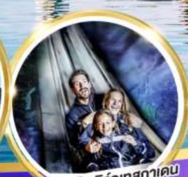
เหมืองเกลือบิรท์เทศาคาเดิน