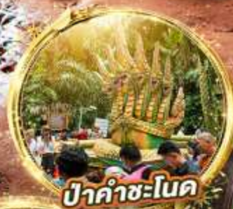
ป่าคำชะโนด