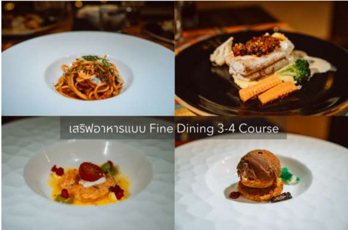
เสิร์ฟอาหารแบบ Fine Dining 3-4 Course