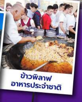
ข้าวพิลอฟ อาหารประจำชาติ