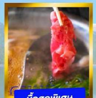
มือสุดพิเศษ