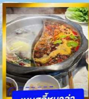
เมนูสุกี้หม่าล่า